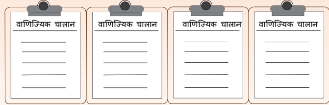
बिक्री का बिल या बिक्री का अनुबंध

सामान्य शब्दों में बीजक, एक विक्रेता द्वारा एक क्रेता को जारी किए जाने वाला एक वाणिज्यिक दस्तावेज होता है। यह व्यापार करने वाले दोनों पक्षों को चिन्हित करता है और बेची गई वस्तुओं को सूचीबद्ध करता है, इनका ब्यौरा देता है तथा इनको परिमाणित करता है, माल भेजने की तिथि दर्शाता है और परिवहन का माध्यम, मूल्य तथा छूट, यदि कोई हो, को दर्शाता है और आपूर्ति तथा भुगतान की शर्तें दर्शाता है। कुछ मामलों में (विशेष रूप से जब इस पर विक्रेता अथवा विक्रेता के एजेंट के हस्ताक्षर होते हैं) एक बीजक भुगतान की मांग के दस्तावेज का कार्य करता है और जब इसका पूरा भुगतान कर दिया जाता है तो यह अधिकार का दस्तावेज बन जाता है। बीजकों के प्रकार में वाणिज्यिक बीजक, वाणिज्यद्वितीय बीजक, सीमा शुल्क बीजक, और प्रपत्र बीजक शामिल हैं। इसे बिक्री बिल अथवा विक्रय संविदा भी कहा जाता है।